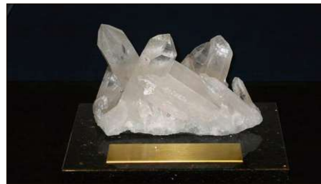
Cristal da Pro Infirmis 2015.

La surdada dal premi ha lieu mesemna, ils 25 da november 2015 en la sala Calven a Cuira. Fin l'ultim termin d'annunzia ils 28 d'avust 2015 pon ins nominar atgnas purschidas u purschidas da terzs. Ils documents d'annunzia ed ulteriuras infurmaziuns chattais Vus qua: www.graubuenden.proinfirmis.ch